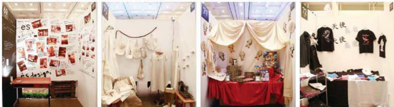
069 es-design 070 nuuno. 071 イーサキング 072 天使悪魔