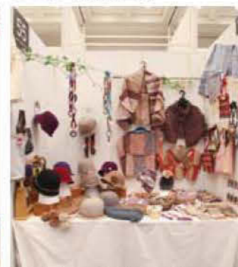
055 あんで〜る♡おって〜る