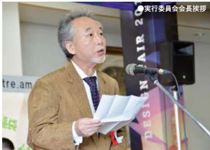
●実行委員会会長挨拶