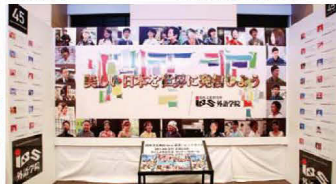
045 比較文化研究所・IBS外語学院