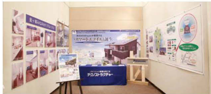
061 株式会社 Misumi スマートハウス