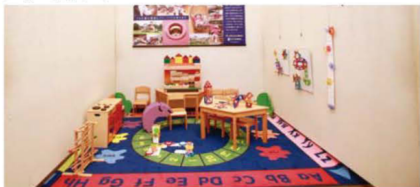
010 PLAY GLOBAL 丸竹工業株式会社