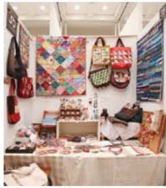
035 こっこんはうす針仕事