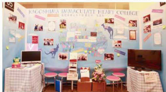
005 鹿児島純心女子短期大学 英語科