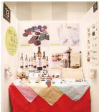
013 かごしまの新特産品コンクール