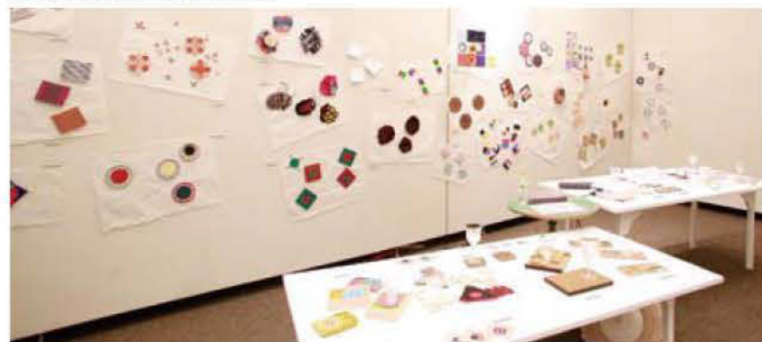
060 White Gallery