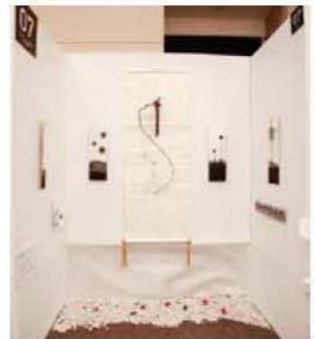
007 フラワースペースM-24 西 真理子