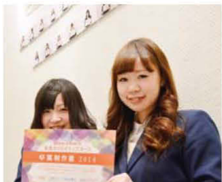
006 鹿児島純心女子短期大学 生活クリエイティブコース