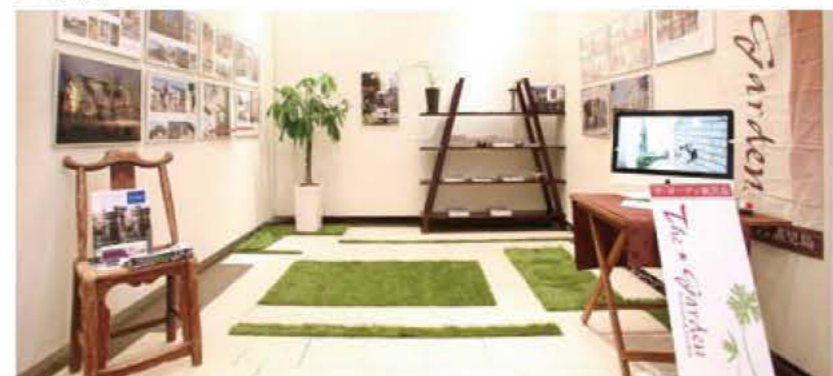
050 The-Garden 鹿児島