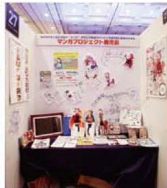
027 マンガプロジェクト鹿児島