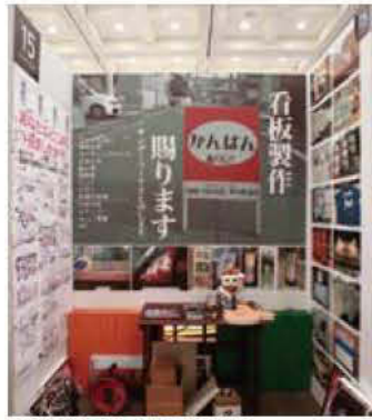
015 THUNDER WORKS