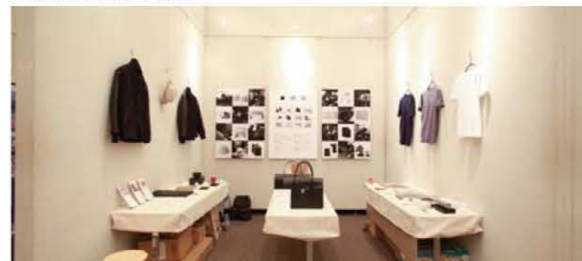
037 典型鹿児島支部(株式会社)