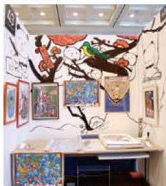
043 バンダ絵師あごばん