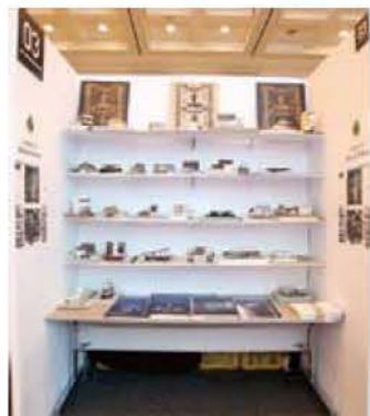
003 株式会社森昌建築設計事務所