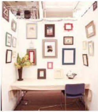
023 アトリエ イルドパニエ 瀧川恭子