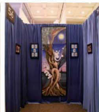
056 大嵩 文雄