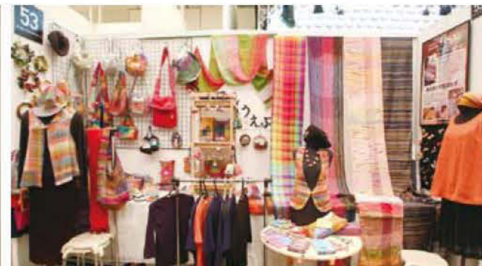
053 NPOさをり工房うえ〜ぶ