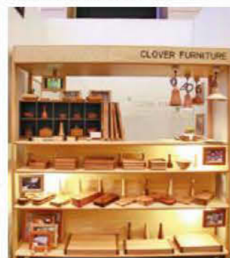
048 CLOVER FURNITURE