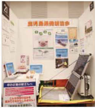
021 一般社団法人 鹿児島県発明協会