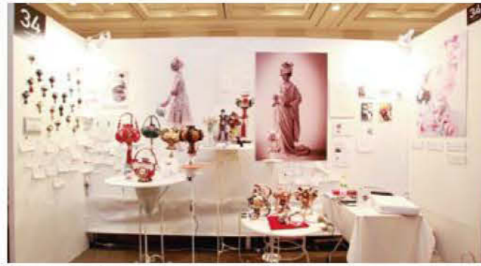
034 en mo yukari