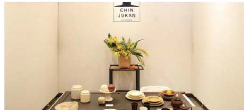
019 チンジュカンポタリーストア