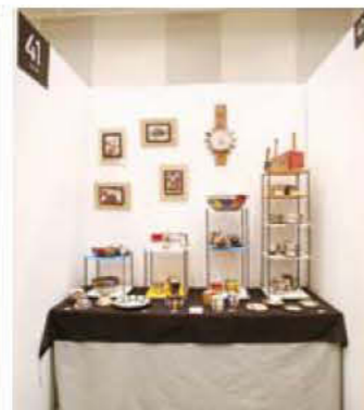
041 岩元 鐘平