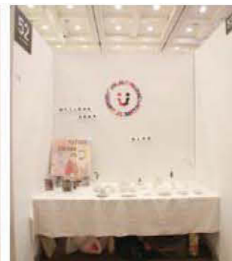
052 ega o (額川 直樹)