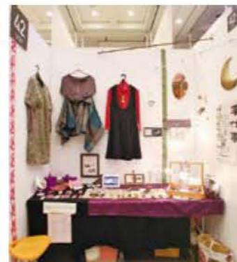
042 水元和賀子 HardなHeart