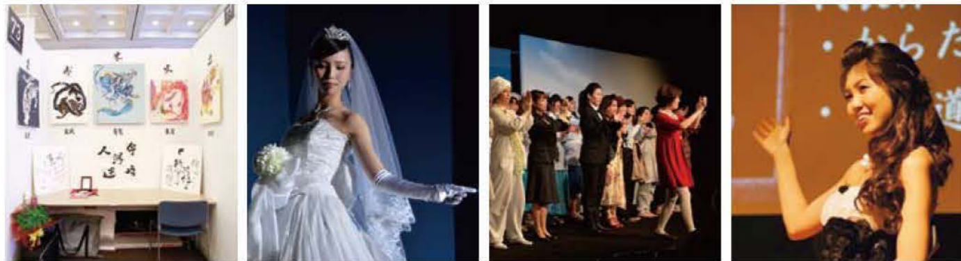
073 鳳宮堂【ほうきゅうどう】 鹿児島純心女子短期大学 生活クリエイティブコース Creative Collection 2014 鹿児島純心女子短期大学 英語科 ミュージカル「アニー」 iBS外語学院全日制コース 英語スピーチライブ