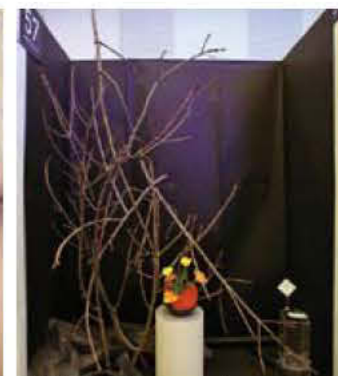
057 川澄佳乃*tau works