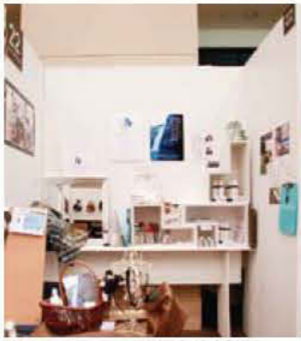
022 ヒラノマリナ 鹿児島美人計画