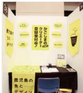
036 STUDIO K.