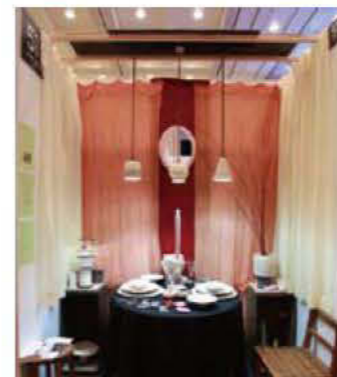
051 御茶碗屋つきの虫