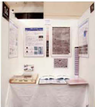
014 鹿児島県工業技術センター