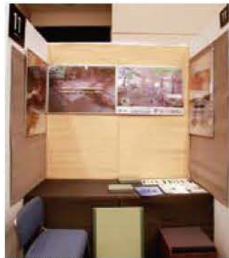
011 仙 夢