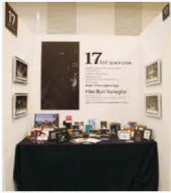
017 機スペースプラン