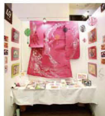
049 KIRI WORK