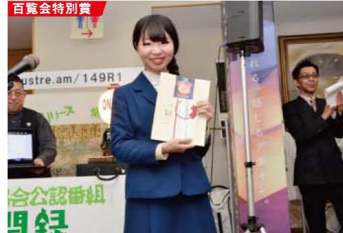
●鹿児島純心女子短期大学生生活クリエイティブコース 百覧会奨励賞