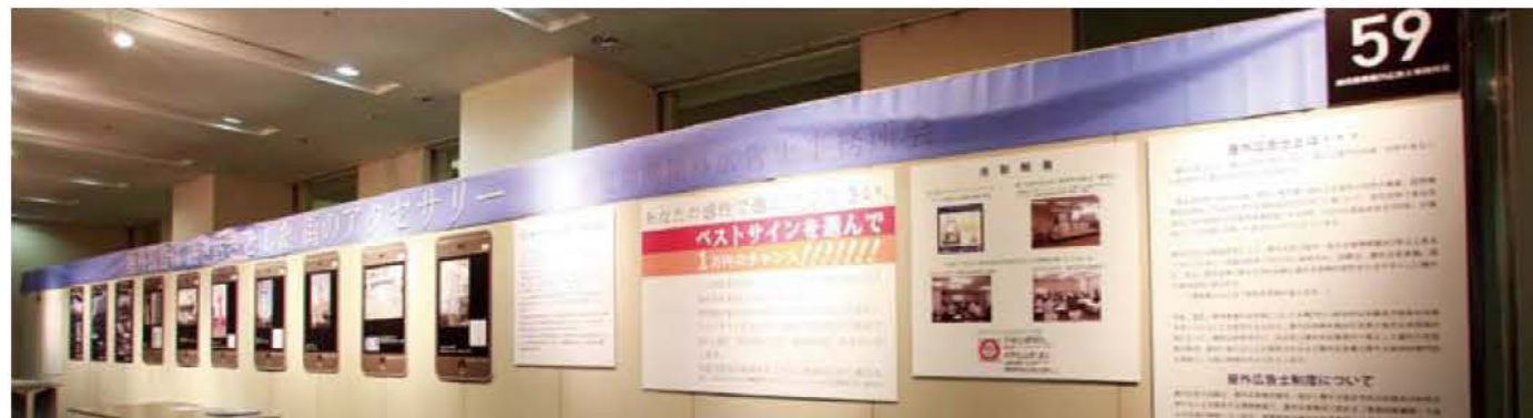
059 鹿児島県屋外広告士事務所