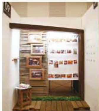
009 株式会社新生インテリアデザイン