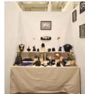
08 村岡 良寛