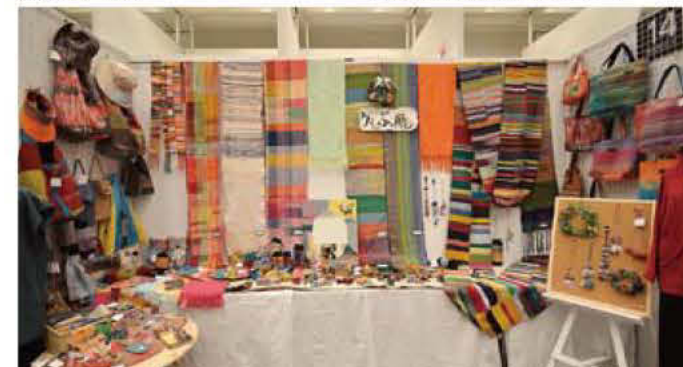
14 さえり工房 うえすぶ