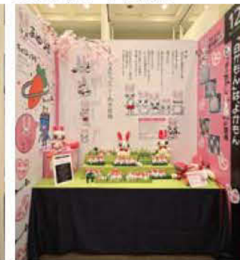
12 (株)スペースプラン