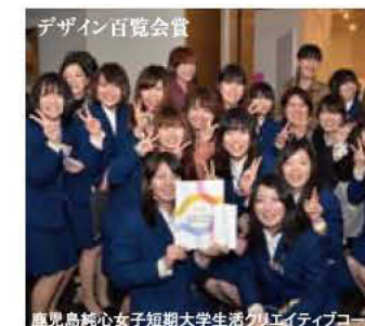
デザイン百覧会賞