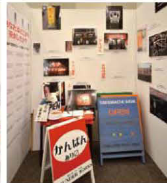
06 THUNDER WORKS