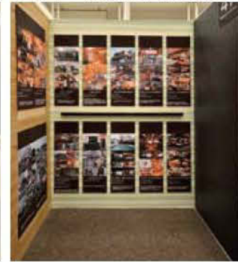
47 株式会社新生インテリアデザイン