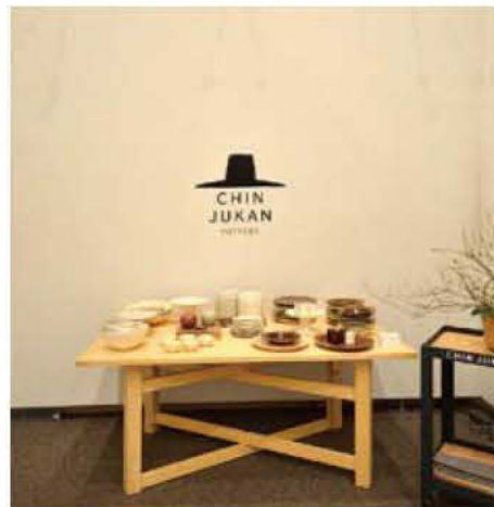
60 チンジュカンポタリー