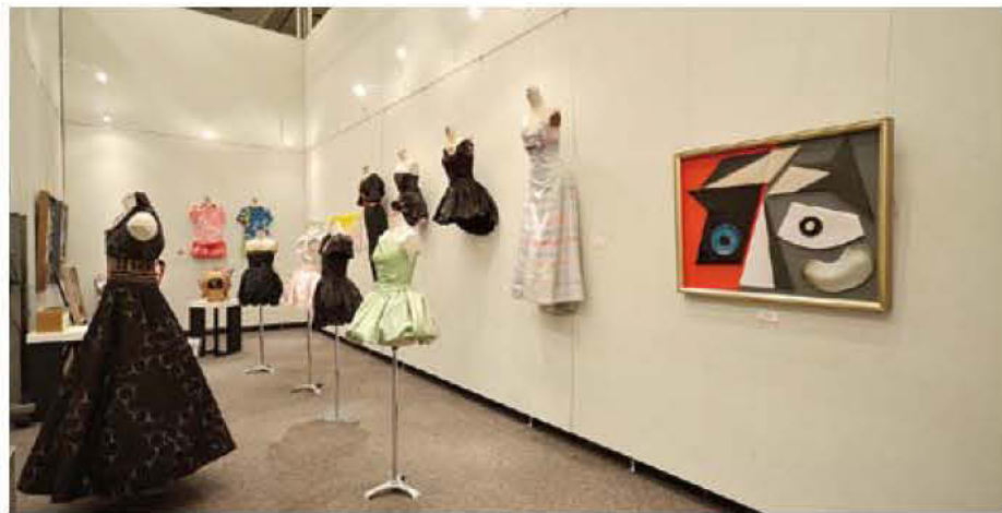
07 鹿児島純心女子短期大学 生活クリエイティブコース