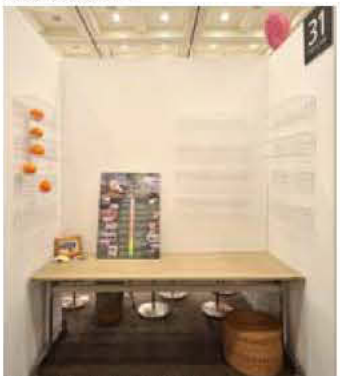
31 ゲストハウス 月の港