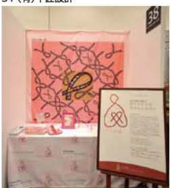
38 NPO法人 あなただけの乳がんではなく