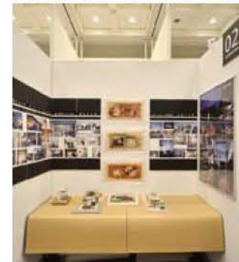
02 (株)小森昌章建築設計事務所