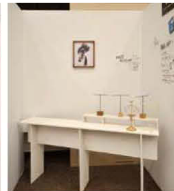
13 (株)Mar United