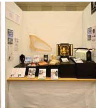
10 鹿児島県工業技術センター