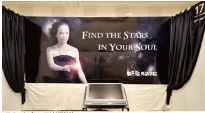
17 南アカデミーIBS外語学院