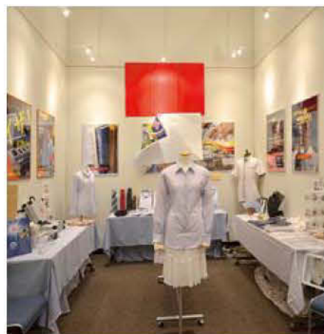
15 高山CHOYAソーイング株式会社