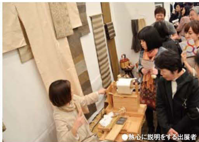
●熱心に説明をする出展者