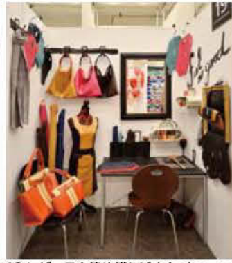
19 レザースタ染め織りジオ feel so good20 (株)仙 夢