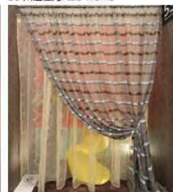
53 in my room