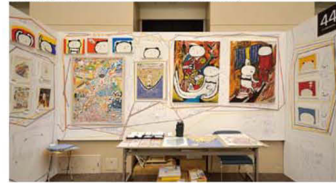
44 ハンダ絵師 あこぼん