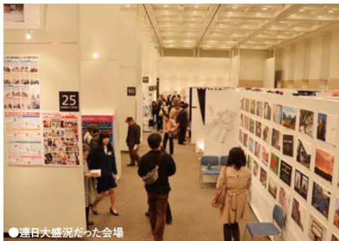
●連日大盛況だった会場