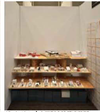
43 オノケン | 太田則宏建築事務所