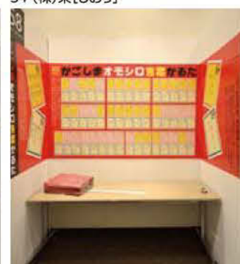
58 言葉◎デザイン◎しおつよういち