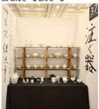
37 舞茅窯(ソウボウガマ)