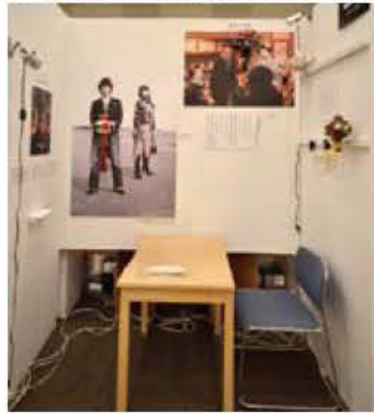
21 en mo yukari エンタープライズ