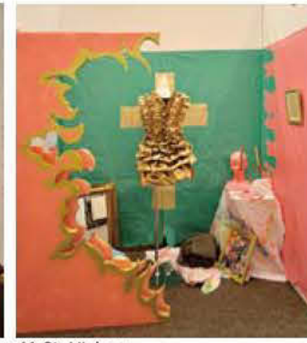
41 St. Hickory