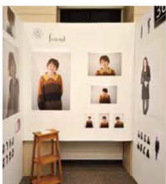
36 hair & make found