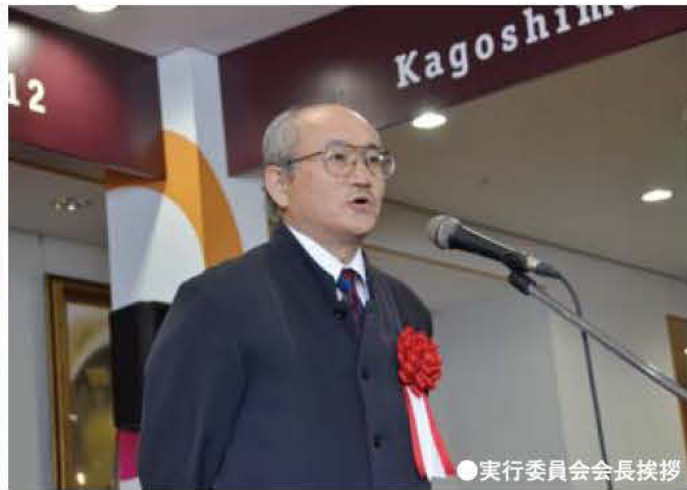
●実行委員会会長挨拶