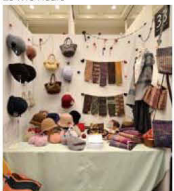
33 あんで〜るおって〜る