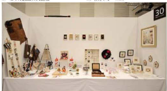
30 大隅はんどくらふと協会