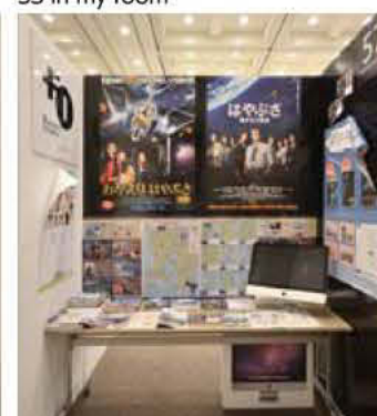
57 NPOカゴシマフィルムオフィス