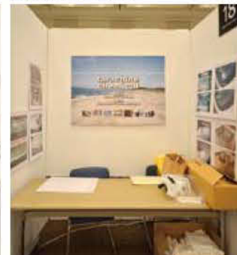
18 (有)タラチネケミカル