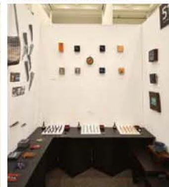
51 陶工房 遊々夢人