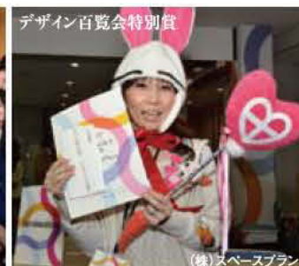
デザイン百覧会特別賞