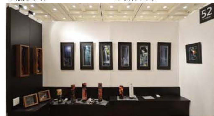
52 スーリア写真工房