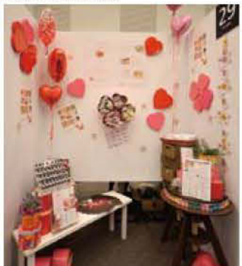
29 M's Heart