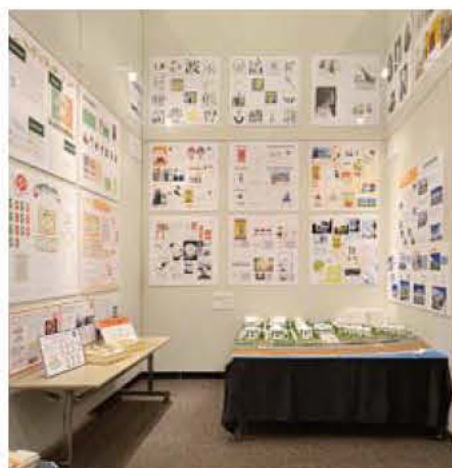
25 鹿児島情報ビジネス専門学校