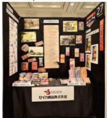
27 セイカ食品株式会社