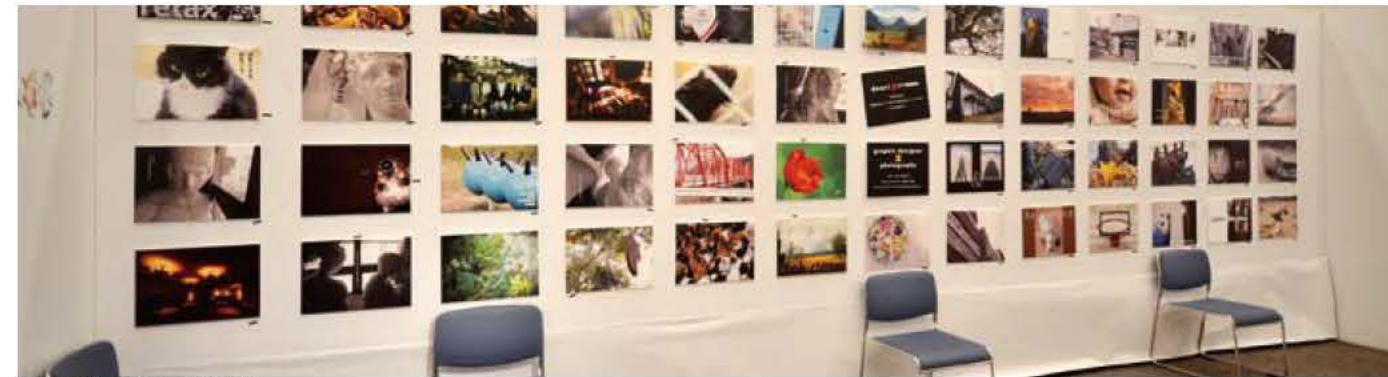
01 ドゥ・アートxアートハンズ