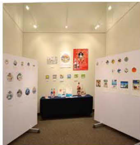
45 (株)AOB&ダヴィンチインターナショナル