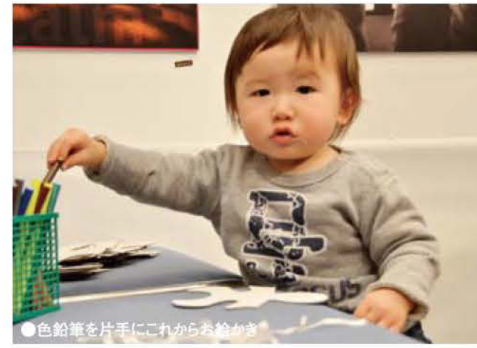
●色鉛筆を片手にこれからお絵かき

成熟期とも言える21回目の「かごしまデザインフェア2012」も多くの出展者・企業と 毎回お越しいただく数多くの来場者に支えられ、盛況・盛會に終われたことに感謝申し上げます。総合展示部門責任者として今回は、これまでの大ホールだけにとどまらず中ホールと2階通路・ラウンジスペースまで使った展示が出来、各ブース・出展者の特徴をより活かせたと思います。また、来年度も同時期に開催できるよう、すでに大ホールと中ホールは予約し押えました。この記事を読んでいる皆さんもぜひ来年度は参加していただき、新しい出展者の発掘をもう初めています。再来年の2014には県民ホールを貸し切ってステージでの発表も企画しています。身近な身の回りにいっしょに、デザインに係わる人々にぜひ参加していただき、広く県民の皆様へ地場のデザインの活用について知っていただき次代につなげる活動をして行きましょう。