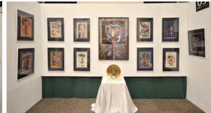
05 デザインアートおおたけ