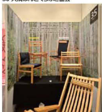
35 工房 彩光