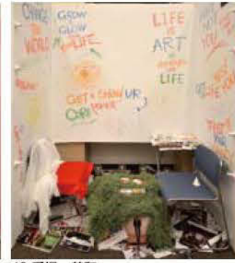
42 愛場 美和