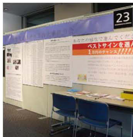
23 鹿児島県屋外広告士事務所