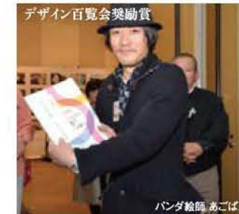
デザイン百覧会奨励賞