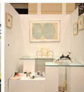
56 White Gallery