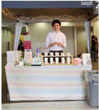
22 SANDECO COFFEE