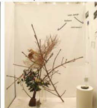
50 川邊佳乃/tau works