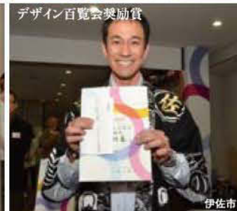
デザイン百覧会奨励賞

期間中、来場者1,000・2,012・3,000・4,000人目に記念品を提供して下さった、高山CHOYAソーイング株式会社様に心より感謝申し上げます。